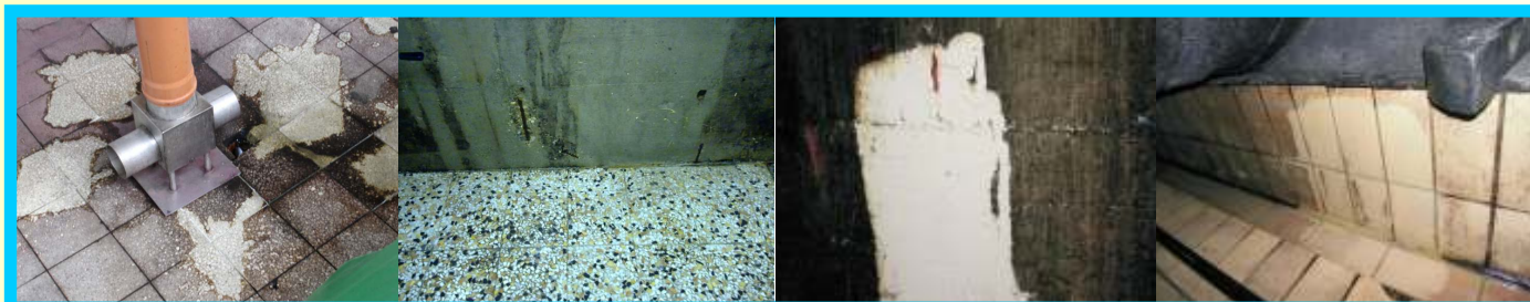
Za tla v kletih, stene, strope...