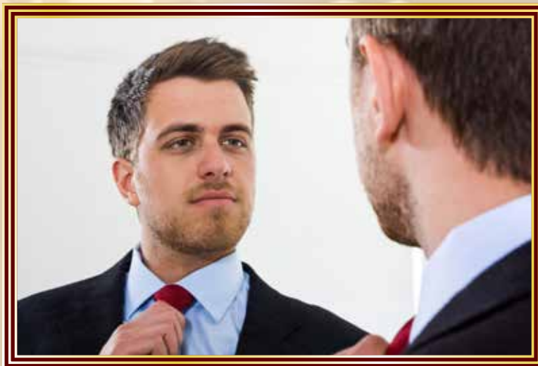
Da bi lahko preživel, si je o sebi zgradil podobo kot o izjemno pomembni, grandiozni osebi. Prepričal se je, da ne potrebuje nikogar.

poznali, vam v branje toplo priporočam knjigo Rossa Rosenberga: The Human Magnet Syndrome , ki govori o narcisih in soodvisnikih. ●