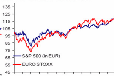
S&amp;P500 vs. Euro Stoxx (-1 y)