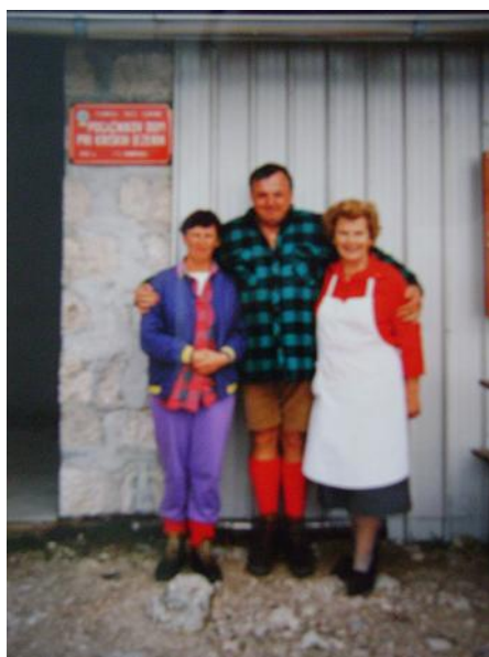
Pred Pogačnikovim domom na Kriških podih